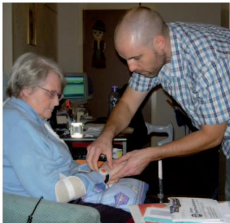
Vérification de routine par le collaborateur social